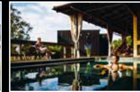
Art Garden Spa